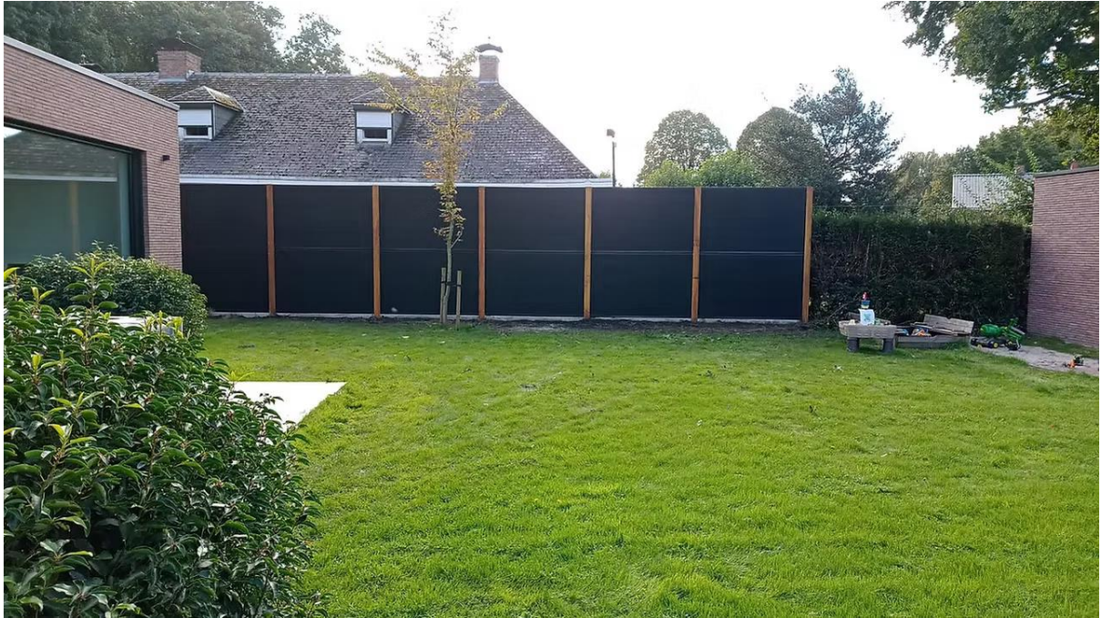
Version standard: Full Black